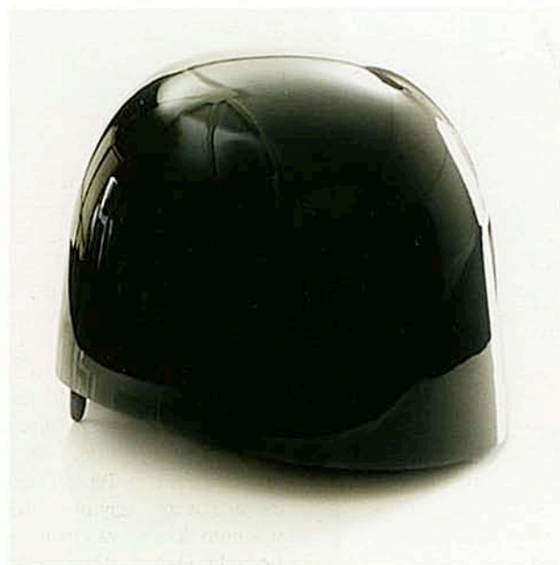
Stool 1 (2005)