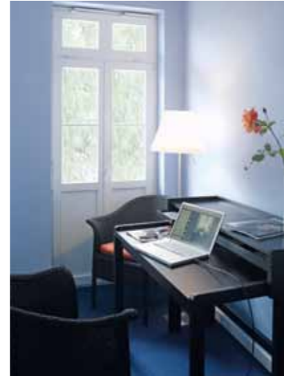
19 Blauwe kamer | Blue room