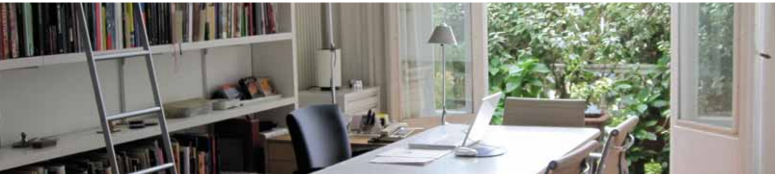
3 Besprekkamer op de 3e verdieping | Meeting room on the 3rd floor, 2009