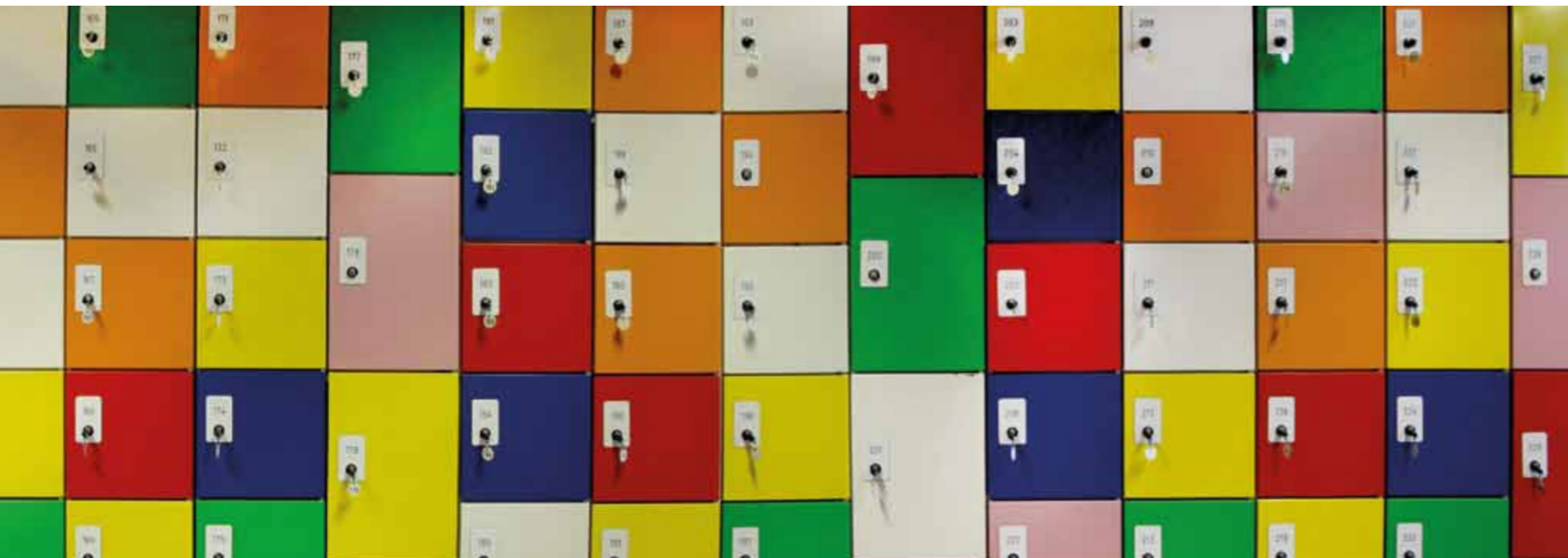
1 Tropenmuseum, Amsterdam 2006 Garderobe Cloak room