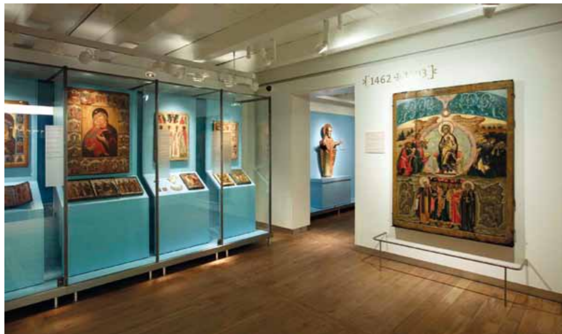
30 | 31 Hermitage Amsterdam 2011 Glans en glorie Splendour and Glory