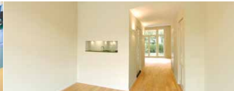
Particulieren | Private homes