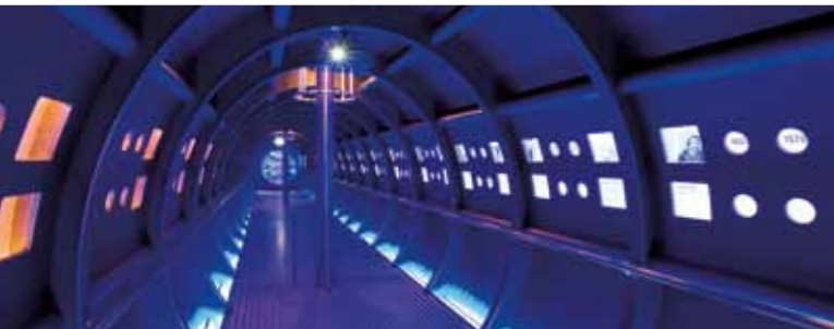
Museale projecten | Museum projects