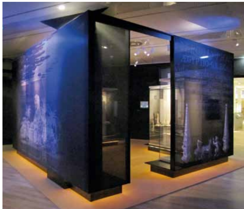
32 | 33 Rijksmuseum van Oudheden, Leiden 2010 Egyptische magie Egyptian magic