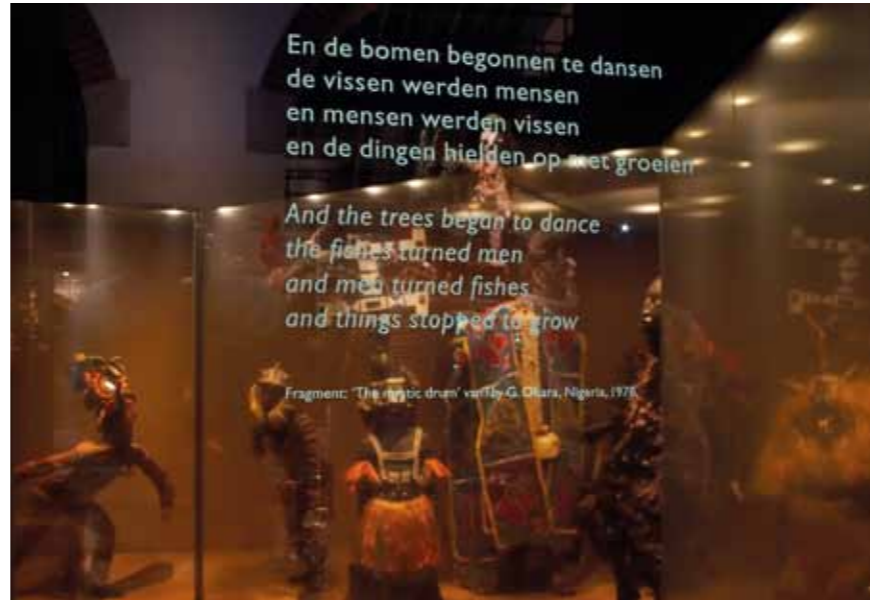
7 Entree Maskerade | Entrance Masquerade