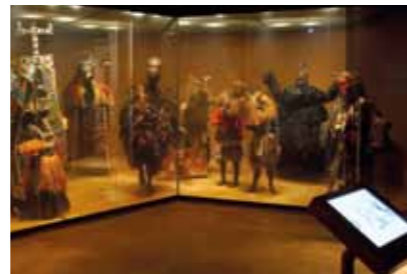
8 Vitrine Maskerade | Showcase Masquerade