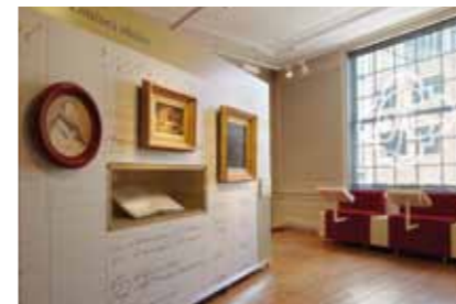
15 Ontmoet de Willets | Meet the Willets 2010

presentation'), who handles the process of translating the theme to the general public, in collaboration with the education department.'