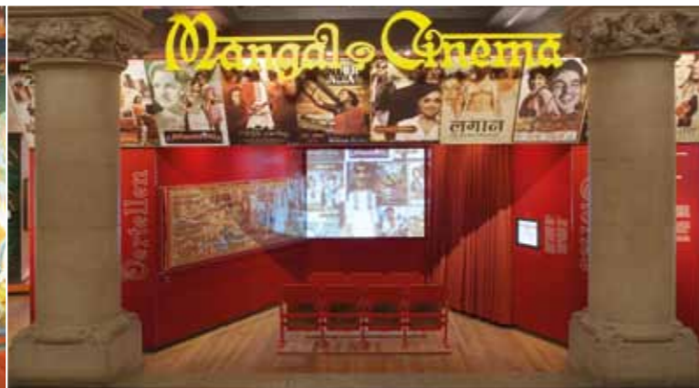
24 | 25 Tropenmuseum, Amsterdam 2008 26 | 27 Rondon India Round and about India