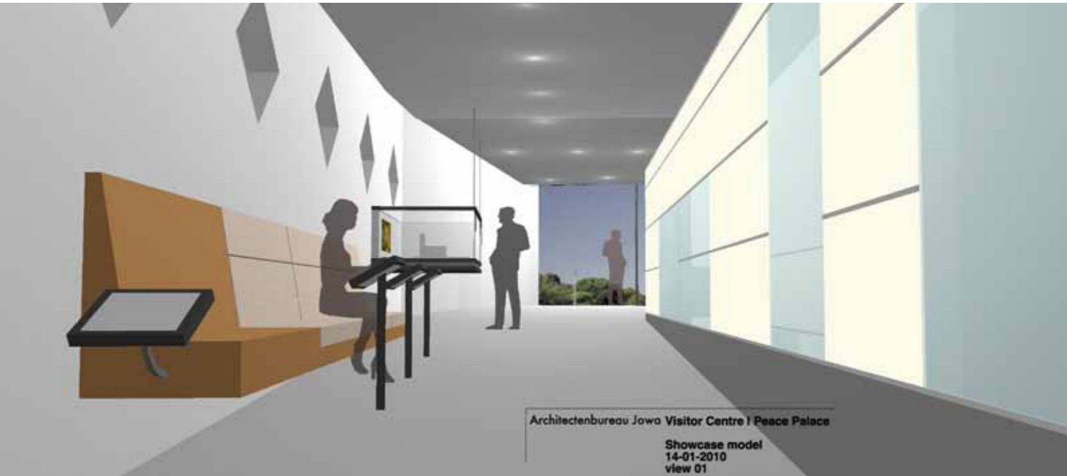
22 Vredespaleis, Den Haag 2010 Voorlopig ontwerp Bezoekerscentrum Preliminary design Visitors Centre