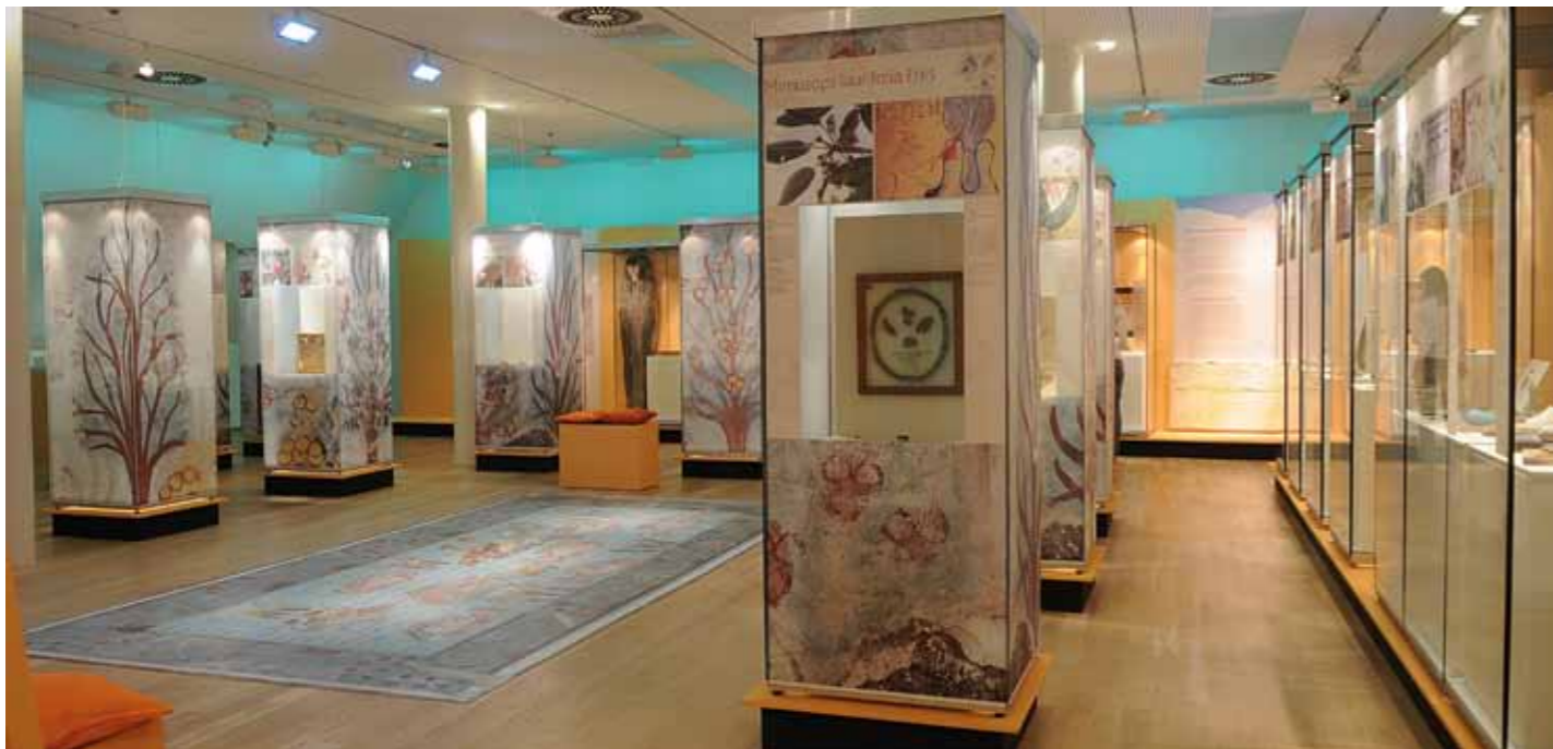
28 | 29 Rijksmuseum van Oudheden, Leiden 2012 Tuinen van de farao's Gardens of the Pharaohs