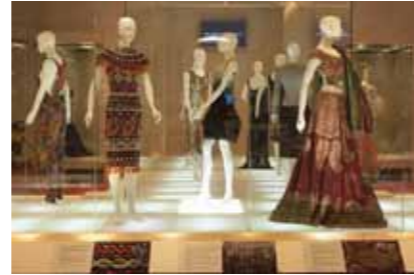
10 Pracht en Kraal | Beauty and the Bead 2006