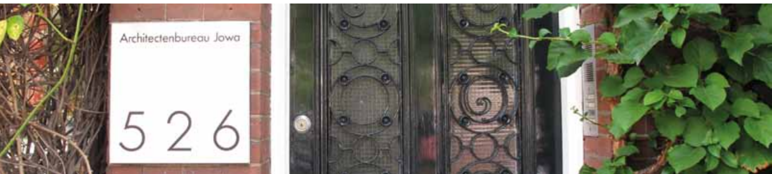
Voordeur | Front door 4