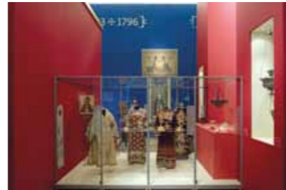
12 Glans en glorie | Splendour and Glory 2011