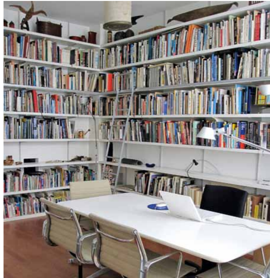
6 Handboekerij On hand library