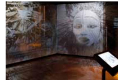
9 Projectie op ruit | Projection on pane