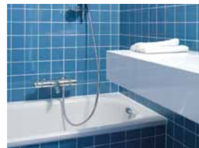
21 Blauwe badkamer | Blue bathroom