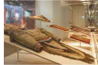
11 Pracht en Kraal | Beauty and the Bead 2006