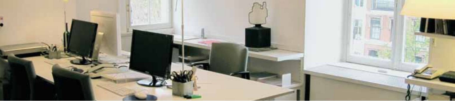
2 Kantoor op de 4e verdieping | Office on the 4th floor, 2009