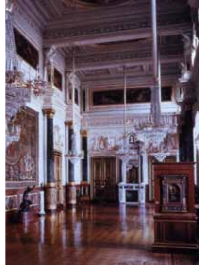
16 Hermitage, St Petersburg 2002 Da Vinci Zaal voorheen Da Vinci Room before