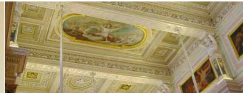
Verlichting | Lighting