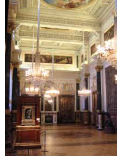
17 Hermitage, St Petersburg 2003 Da Vinci Zaal nieuwe verlichting Da Vinci Room new lighting