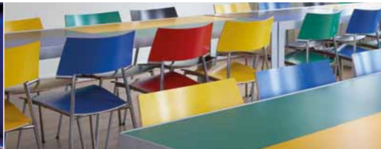
Kantoren en openbare ruimten | Offices and public venues