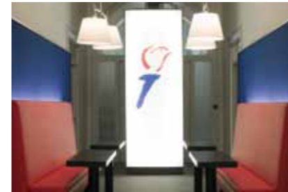
13 Nationaal Comité 4 en 5 mei 2008