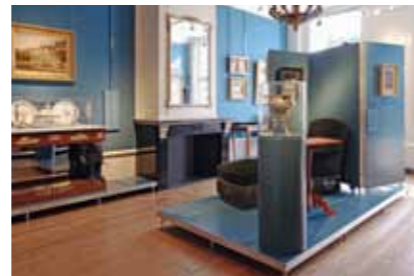
14 Ontmoet de Willets | Meet the Willets 2010