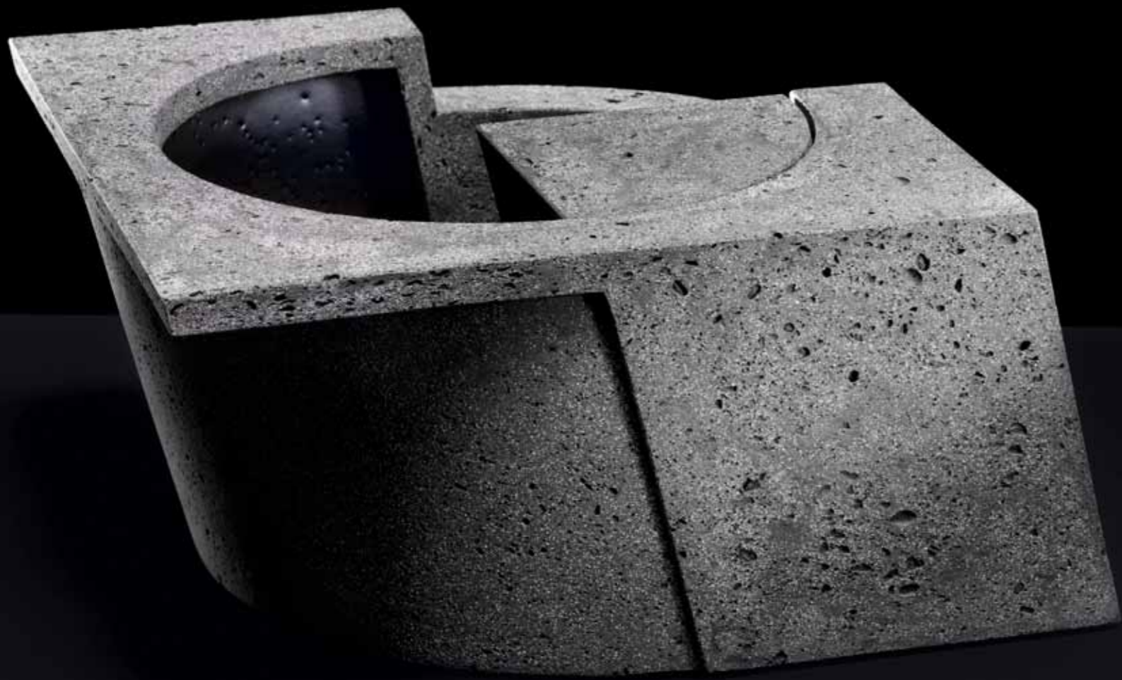
69 586 Rectangular Series 16, 2006 ceramics, 33 x 28 x h16 cm coll. Fuchs / Hauser

Het Prinsessehof, Leeuwarden as well as for his later work. Because of this hermetic nature, his objects are able to transcend the mere technical part and continue to evoke fascination.